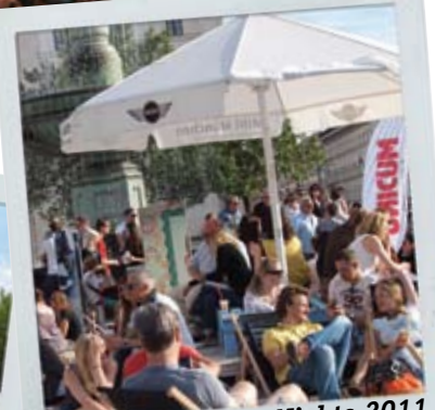
UNICUM Summer-Nights 2011 sponsored by OCB