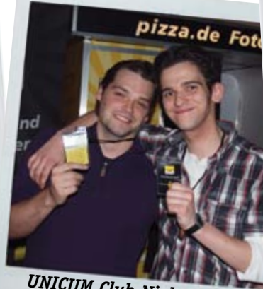
UNICUM Club-Nights 2011 sponsored by pizza.de